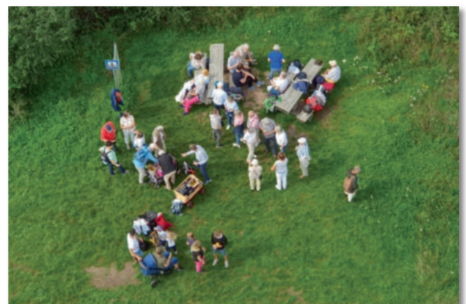
Aus 24 Meter Höhe sieht alles so klein aus.