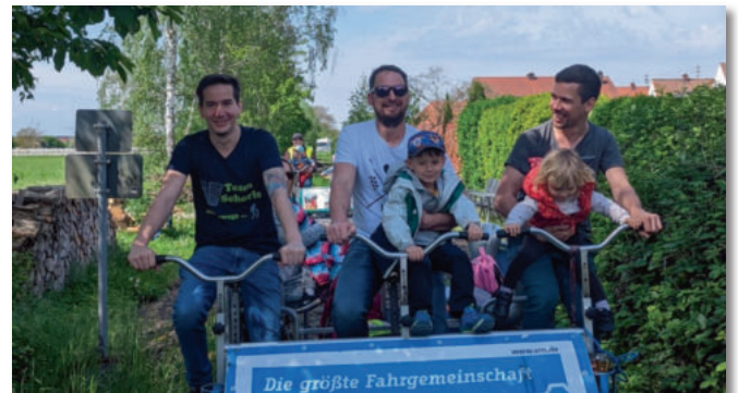
Die Draisinenfahrt ist fester Bestandteil des Familienprogramms.

Sportlich ging es im Mai mit unserer Draisinenfahrt von Bornheim nach Westheim weiter. Hier konnten Klein und Groß auf Gleisen ordentlich in die Pedale treten. In Westheim wurde auf einem nahen gelegenen Spielplatz gepicknickt und gespielt. Bis es dann auf derselben Strecke wieder zurückging.