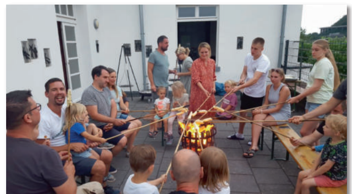
Stockbrot kommt immer gut an.

Unsere Wanderfahrt im Juli führte uns in das kleine Örtchen Leutesdorf am Rhein. Auch dort wurde viel gelacht und sich gut ausgetauscht. Nach der Nachtwächtertour mit Fackeln, tollen Aussichtspunkten und einer riesigen Panoramschaukel endete das Wochenende mit einer