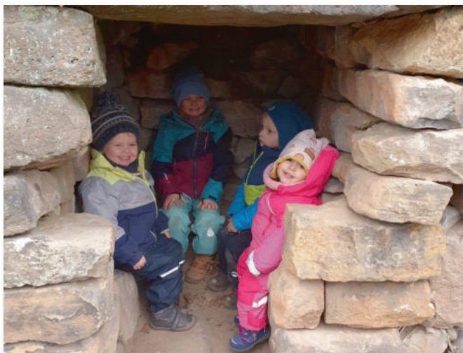
„Sucht uns doch!“ Das perfekte Versteck auf der Wolfsburg.

Im März ging es bei schönem Frühlingswetter gemeinsam auf die Wolfsburg. Dort konnten die Kinder herumtoben und die Burg entdecken, während die Eltern bei einem gemütlichen Picknick zusammensaßen. Danach ging es über den Ludwigsbrunnen zurück zur Haardt.