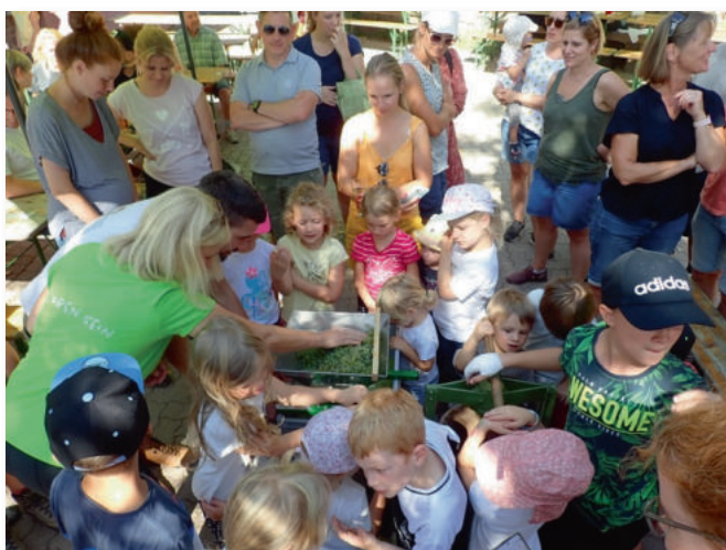
Unsere Jungwinzer in Aktion. Es war ein guter Jahrgang.

Die traditionelle Weinlese auf der Hohen Loog durfte auch nicht fehlen und wurde mit einem unterhaltsamen Kinderprogramm und schönen Kinderliedern ausgeschmückt.