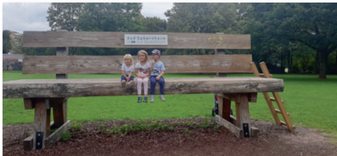
Die Bänke in Bad Sobernheim eignen sich für Groß und Klein.

Wie ihr hier in der Info gelesen habt, haben auch die jungen Familien unsere Fahrt ins Blaue im August unterstützt und waren beim Barfußpfad in Bad Sobernheim dabei.