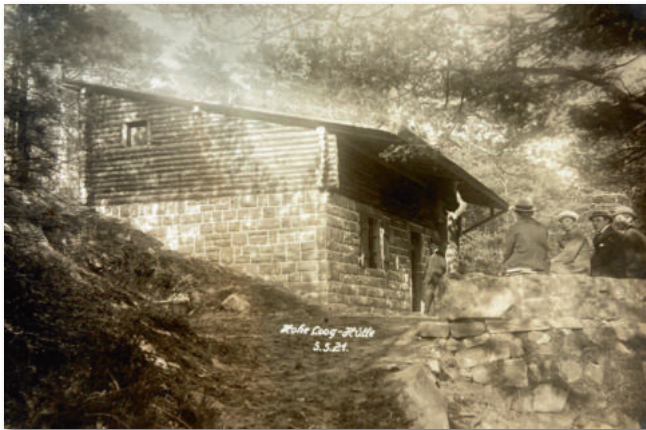
Die erste, einfache Hohe-Loog-Hütte im Mai 1921, sie wurde 1933 abgerissen und durch das heutige Sandsteingebäude ersetzt.

ES KLINGT UNGLAUBLICH, IST ABER WAHR: VOR 110 JAHREN GAB ES PLÄNE, AUF DER HOHEN LOOG EINEN PRUNKBAU ZU ERRICHTEN. WIESO SCHEITERTE DAS PROJEKT?